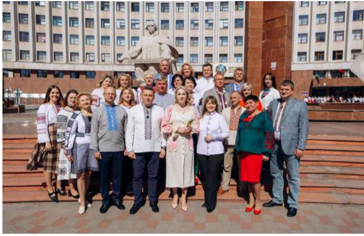
Колектив департаменту охорони здоров'я з головою ОДА/ОВА Світлоною Онишук.

Як відзначали День вишиванки 16 травня в медичних і освітніх закладах Прикарпаття – короткий фотозвіт.