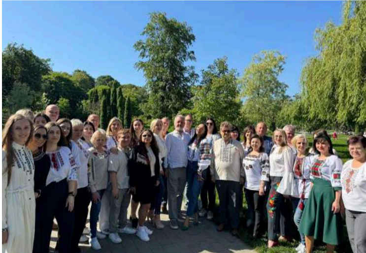
Колектив КНП «Центральна міська клінічна лікарня Івано-Франківської міської ради».