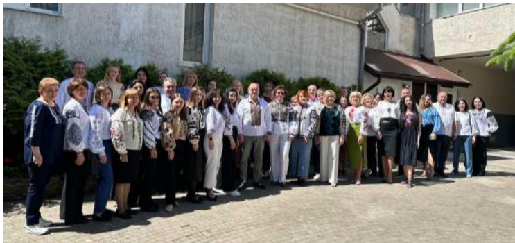
Колектив ДУ «Івано-Франківський обласний центр контролю і профілактики хвороб МОЗ».