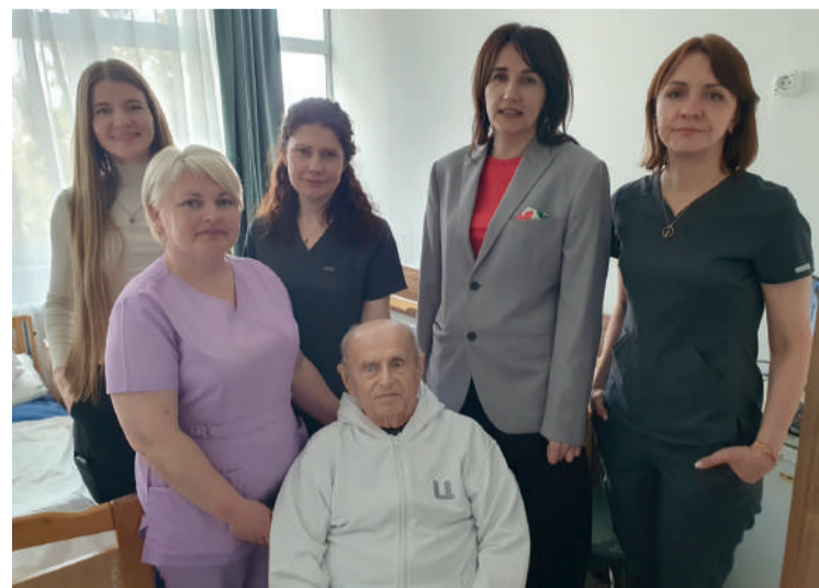
Фото 3: команда реабілітологів.